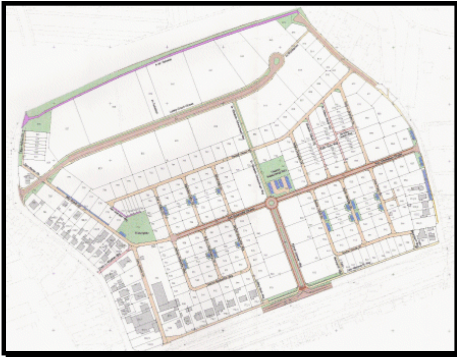
Περιοχή οικοδόμησης «Lorsch-Viehweide» Κάτοψη εκ της οριστικής μελέτης

Η περιοχή οικοδόμησης περιορίζεται από την εθνική οδό τεσσάρων λωρίδων B47 στα βόρεια και την επαρχιακή οδό K31 στα νότια, όπως και από άλλες οδούς τοπικής σημασίας δυτικά και ανατολικά.